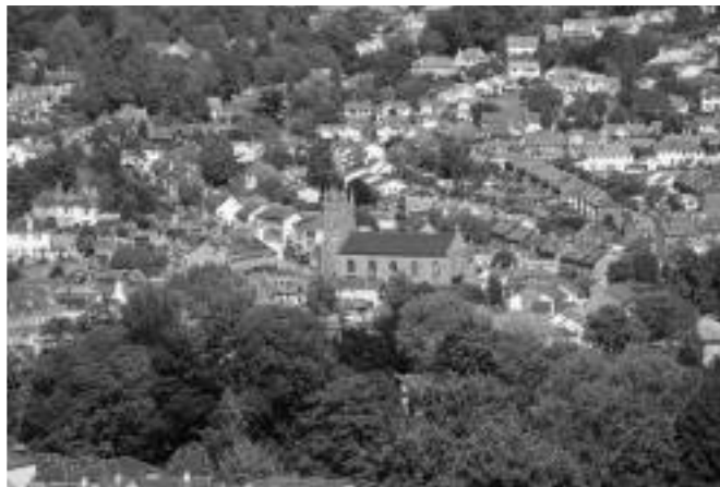
Totnes, en Angleterre, première ville à avoir entrepris une démarche de Transition

* L'auteur est membre du comité de coordination du Mouvement québécois pour une décroissance conviviale et a entre autres dirigé l'ouvrage Objecteur de croissance chez Écosociété.